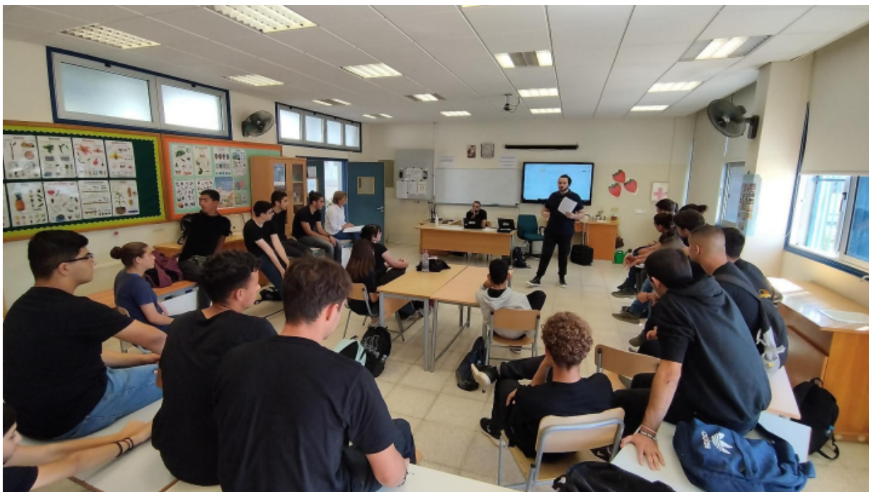
Szkoła Avgorou VET (u góry) i szkoła A' Nicosia VET Socratic Seminars (u dołu)

Obrady obywatelskie | Akcja klimatyczna | Zielony Ład UE